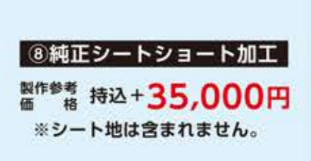
⑧純正シートショート加工