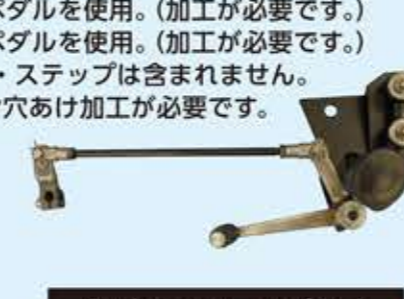
⑥バックステップ(L) とシフトロッド