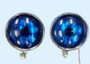
㉒ブルーフォグランブ