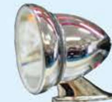
⑳ MFDレジン製 カウル専用バッジ