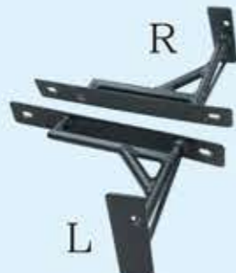
②カウルサイドステー