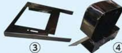
③リアカウルステー